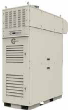
Микротурбина С65 ИСР